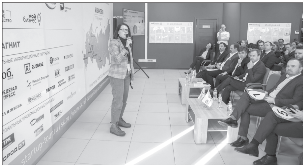
Региональный этап Open Innovations Startup Tour - масштабное мероприятие по поиску перспективных стартапов - завершился.

«В этом году «Сколково» отмечает 10-летие своей работы. Мы видим, как меняется страна, меняются стартапы, люди постепенно меняются. Но самое главное, чего коснулись кардинальные перемены, — это география. Мы очень рады, что все больше перспективных проектов возникает в российских регионах, где раньше об инновациях и не думали. Мы горды, что определенный положительный вклад в этот процесс сделал и Инновацион-