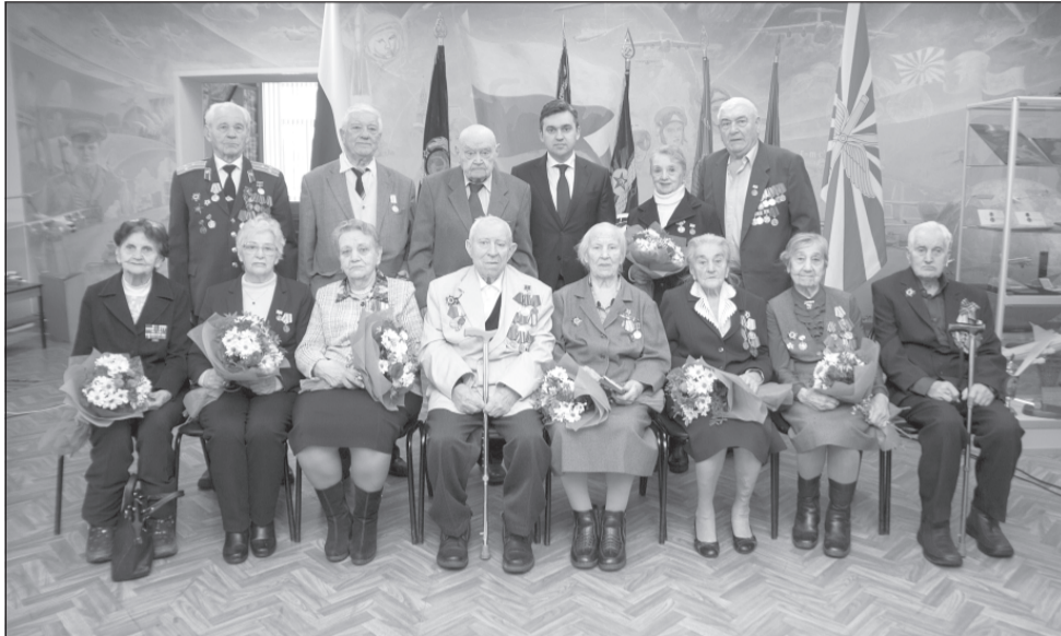
Губернатор Ивановской области Станислав Воскресенский встретился с участниками Великой Отечественной войны и жителями блокадного Ленинграда.

Губернатор Ивановской области Станислав Воскресенский встретился с участниками Великой Отечественной войны и жителями блокадного Ленинграда. Глава региона пообщался с ветеранами и вручил памятные медали «75 лет Победы в Великой Отечественной войне».