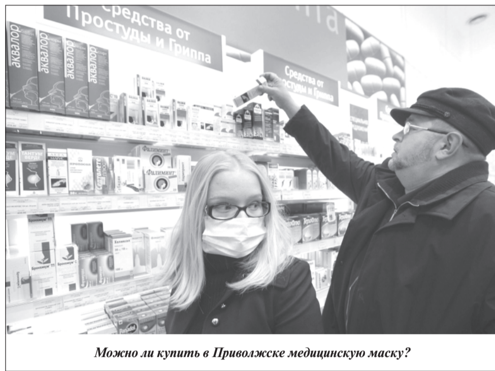
Можно ли купить в Приволжье медицинскую маску?