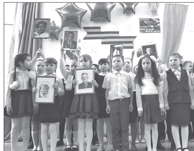
Публика тепло встречала маленьких артистов