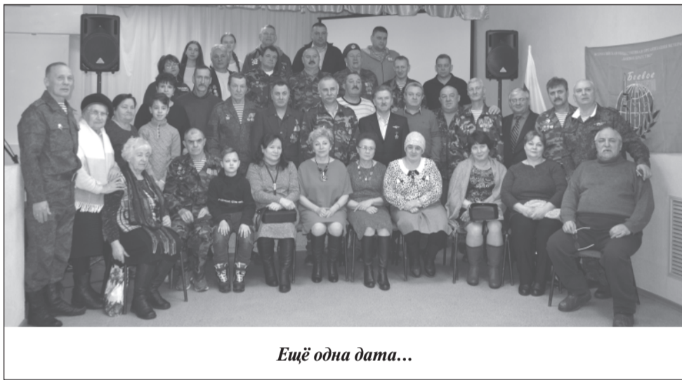
Ещё одна дата...

Лишь только зазвучала первая песня, рассказывающая о войне в Афганистане, как зал встал. Кажется, они были готовы всматриваться в кадры тех лет и вслушиваться в слова песни бесконечно долго и внимательно. Наверняка, каждый вспоминал себя и своих товарищей, вспоминал то время, когда они были молоды и бесстрашны и ещё не знали, что их ждёт впереди... Сегодня, оглядываясь назад, они смело могут сказать, что задачи, поставленные перед ними Родиной, выполнены. Они покинули Афганистан с высоко поднятой головой, оставив там надежду на новую лучшую жизнь. И не их это вина, что в Афганистане сейчас всё