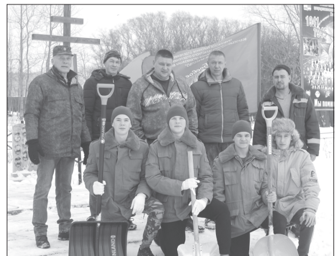
Воспитанники клуба «Патриот» на территории памятного комплекса с. Красинское