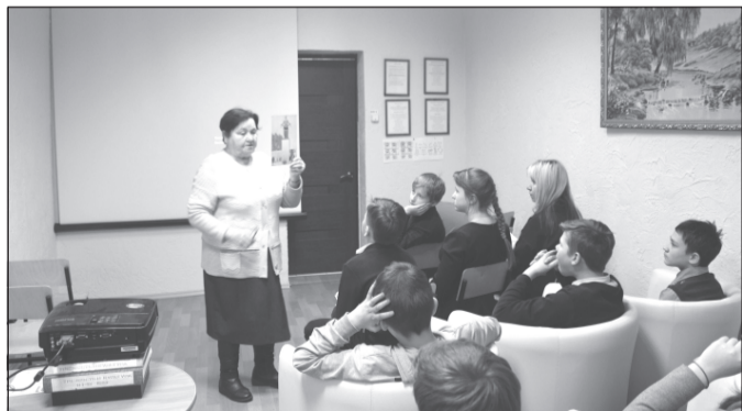
Руководитель школьного музея рассказывает о героическом подвиге ленинградцев

«Снятие блокады Ленинграда» с учащимися Приволжской школы - интернат и ребятами из семей, курируемых отделением профилактической работы с семьей и детьми.