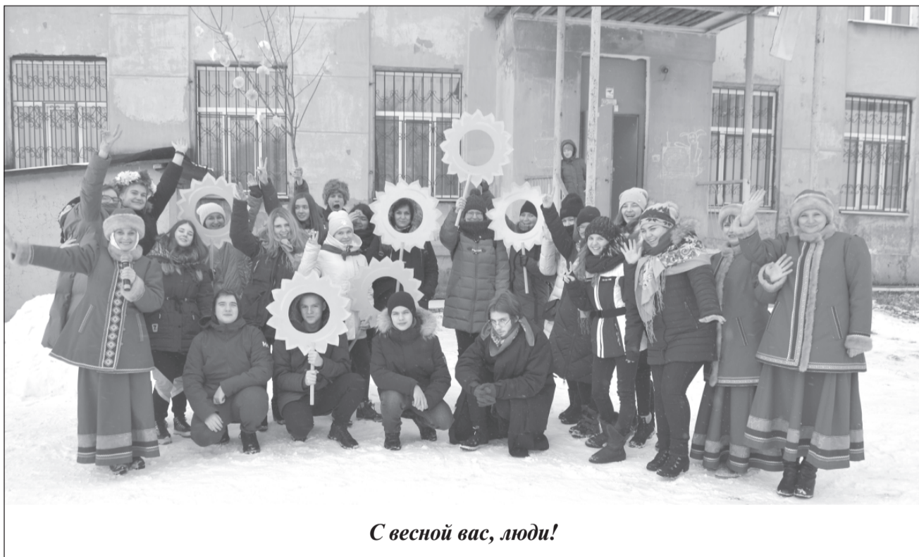
С весной вас, люди!

В этом году извечный спор зимы и весны, что случается на Сретенье, завершился безоговорочно в пользу последней. И вообще она напоминает о себе постоянно, в течение всех последних месяцев. Тем не менее, народная традиция встречаться двум временам года 15 февраля и меряться силами, своего значения не утратила, несмотря на капризы погоды. Так что, разговор о Сретенье состоялся строго по расписанию.