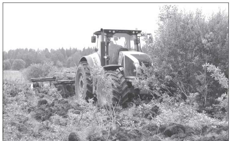
Площади обрабатываемых земель будут увеличены

Руководители хозяйств и фермеры рассказали о планах работы в 2020 году, а также обозначили актуальные вопросы. В их числе — объемы субсидирования, поддержка льноводства, хватка качественных семян.