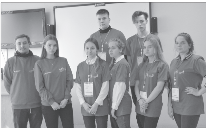
Студенты Плесского колледжа и гости из Санкт-Петербурга готовы к соревнованиям

Сегодня мы ждём, к примеру, от парикмахера, швеи, слесаря по ремонту автомобиля или туроператора не просто оказания услуги, а выполнения её самым качественным и мастерским образом. Вместо девиза прошлых лет «И так сойдёт» всё чаще звучит «Делай мир лучше силой своего мастерства!» Но все в жизни начинается с малого. И прежде, чем приступить к улучшению мира своими собственными руками, надо, как минимум, научиться что-то делать хорошо. Для этого есть много способов, но сегодня речь пойдёт об одном из них — о соревновании молодых профессионалов WorldSkills, девизом которого как раз и являются слова об улучшении мира силой мастерства.