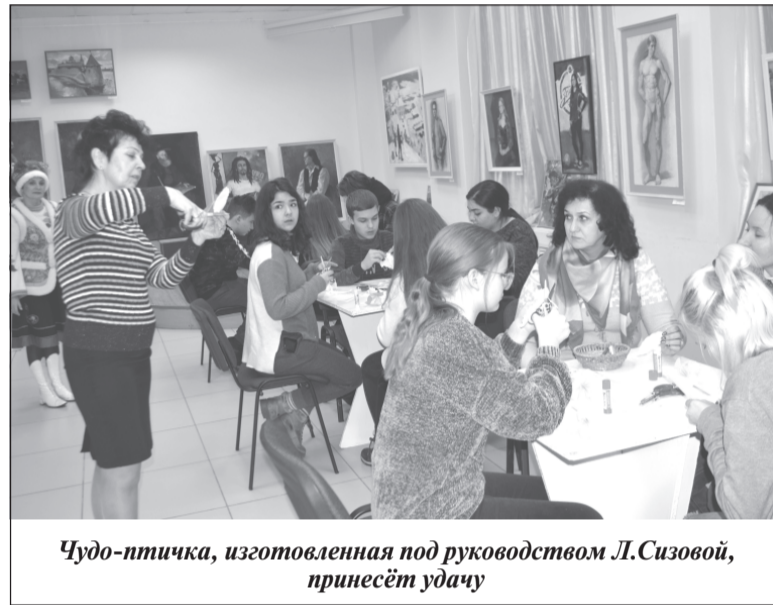
Чудо-птичка, изготовленная под руководством Л.Сизовой, принесёт удачу

ний, развитие интереса к истории родного края. На занятиях дети изучают традиции и быт русского народа, обрядовую культуру. «Хранители» помогают в организации выставок и проведении тематических программ. В сентябре 2019 года на базе музея открылось